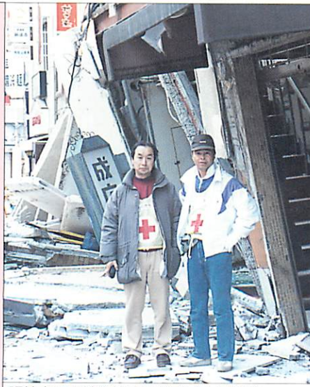
阪神大震災被災地にてボランティア活動

NPO活動を応援! 私も参加した阪神大震災でのボランティア、福井県三国町沖で発生したロシアタンカーの重油流出で活躍した方々など、大災害において、いまや行政だけでは手を尽くせないことが多くあります。つまり、ボランティアをはじめとする市民活動と一体となった県政こそが、豊かな地域社会づくりに欠かせないのです。しかし、こうしたNPO(市民活動団体)は、それを支える社会的基盤が十分とはいえないため、活動がままならない状況にあります。これらの市民活動をより活発にするため、県庁内に「県民運動推進本部」が設置されるとともに市民活動の総合窓口として生活環境部に「県民運動推進室」が置かれ、NPO法案が成立したいま市民活動と県政のさらなる一体化を目指していきます。