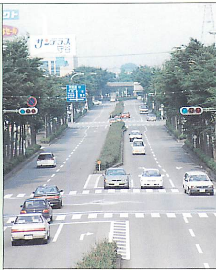
運転免許証取得がスムーズに

『遠隔地受験者』に配慮した運転免許試験場! 平成8年3月、県議会予算特別委員会で「運転免許試験場の受付時間延長」を提言、それを受けてスタートした運転免許試験場受付時間の延長。従来、午前8時から午前9時までだった受付時間が午前9時から午前10時までとなり、試験場のある水戸まで遠い守谷・取手など県南地区のみなさまに大変よろこばれています。また、年に4回行われる出張試験場についても、平成8年5月から取手警察署でも実施されることになり、わざわざ水戸まで行くことなく取手警察署での受験が可能になったので、守谷・取手地区のみなさまがますます受験しやすくなりました。