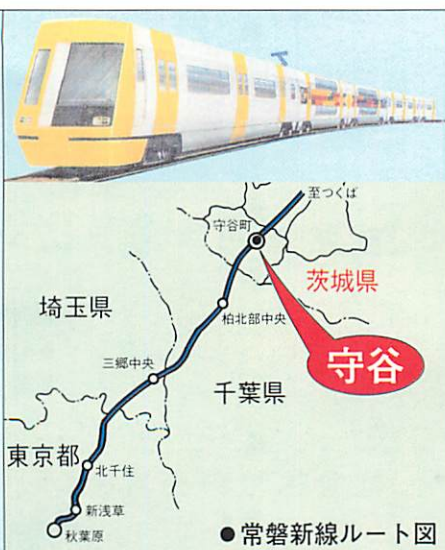
常磐新線イラスト図と予定運行図

高齢者や身障者の方にも使いやすい対応を! 守谷駅は、常磐新線と関東鉄道常総線の連絡駅であることから、スムーズな連絡がとれるように改札口を1ヶ所に集約。2つの路線の駅を同一フロアとすることで利用者の方々の利便性を高めていきます。さらに、駅が2階部分となるため、高齢者や身体障害者のみなさんの利用しやすさを配慮し、エレベーターやエスカレーターを設置することも考えております。 平成17年の開業に向けて着々と進む常磐新線。そのターミナル拠点として今後さらに発展していく守谷駅とその周辺地域の活性化に向けて、みなさまとともに力を合わせてまいります。さまざまな公共施設、そしてまちづくりにご期待ください。