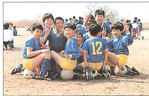
教育・文化・スポーツ