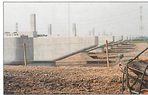
産業振興 早期開業が望まれる常磐新線の小貝川橋梁工事