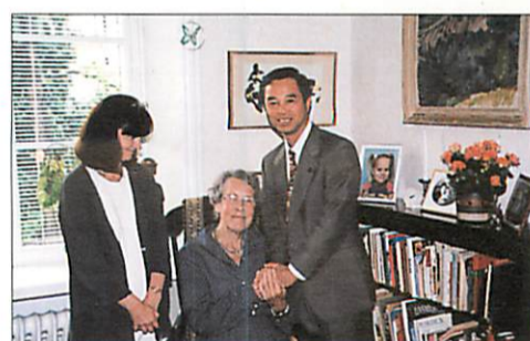
スウェーデン・ストックホルムにて福祉視察