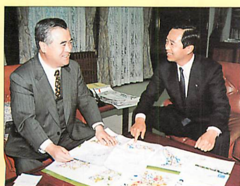
橋本茨城県知事と政策について語る小川議員