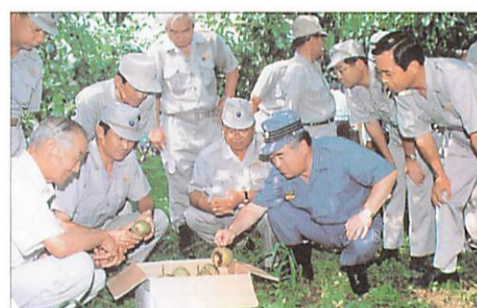
自然との共生 知事と梨の被害状況を視察する小川議員