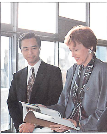
モンテール前駐日アメリカ大使夫人とアーカス構想を語る

芸術・文化・交流のアーカス構想! 原子力施設の安全対策! 「時のアセスメント」導入! 交通安全施設の充実! 霞ヶ浦の水質浄化!