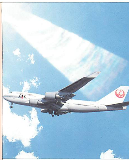
海外がより身近に!

平成8年4月、ついに「取手旅券窓口」が開設! 茨城県内で最もパスポート申請者が多い県南のみなさまからのご要望に応え、平成7年の第一回定例会で「増加する県南地区の旅券(パスポート)申請件数に対応するため、取手市にパスポート申請窓口の設置を」という私の訴えに対し、平成8年4月16日より取手市役所内に取手旅券窓口が開設されました。取手に窓口ができる以前は、守谷町、取手市などの県南に住むみなさんにとって一番近い窓口は、土浦合同庁舎でした。念願の窓口開設の初日は、受付時間を1時間延長するほどでした。