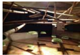
ナンデシャ(インド)の作品

インドから来たナンデシャは竹の空間にモヤシの箱を吊るしたものです。作者に聞いて見ないとわかりませんがモヤシは田んぼのイネのイメージかも知れません。