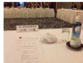
経済4団体の意見交換会

茨城県経済4団体の代表が一同に会い、橋本知事を招いて意見交換をいたしました。私は、商工会連合会副会長として出席。その席上「平成26年度県政への要望・提言」を知事に手渡しました。