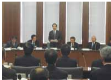
委員長として最後の挨拶(12月11日)

縦割りの弊害にとらわれる事なく執行部の皆さんは我々の提言を真摯に受け止め、スピード感を持って問題の解決にあたってくれました。