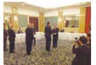
平成26年度県政への要望・提言を手渡す

要望の中には「TXの東京駅延伸」が緊急要望として盛り込まれています。これは私から強く要望して盛り込んだものです。元々はS60年に常磐線の混雑緩和のため、第二常磐線建設が閣議決定され、その時の決定事項が東京駅から茨城県守谷町南部までとなっていたものです。閣議決定どおり早期に着工するよう、改めて強く国に働きかけて頂きたいと、知事に要望いたしました。