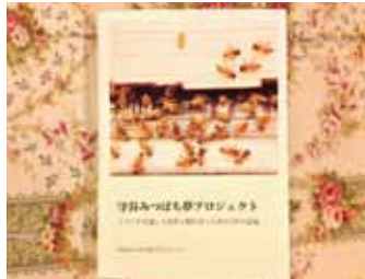
守谷みつばち夢プロジェクトアルバム

今日、最も驚いたのはメンバーの一人が108ページにもおよぶ「守谷みつばち夢プロジェクト」の写真集を作って来たことです。見事な出来栄で参加者全員から驚嘆の声が上がっていました。その貴重な一冊を私にプレゼントして下さいました。