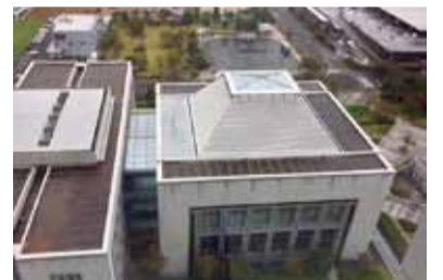
県庁の東側の行政棟から議会棟

12月9日には、常任委員会が開かれました。私は「防災環境商工委員会」に1年間所属しており、最初にかかれた委員会で私は「霞ヶ浦の水質浄化」問題について執行部と論戦をいたしました。そんな経緯もあったので、今日がこの委員会での最後の論戦となり改めてこの問題を取り上げ一日も早く霞ヶ浦の浄化を達成する為に県が一丸となって取り組むべきであると申し上げました。