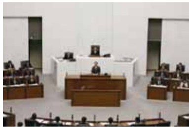
本会議での委員長報告(12月16日)

5月に最初の委員会を開催してから約7ヶ月に9回にわたる委員会を精力的に行い、多くの提言をまとめる事が出来ました。執行部の皆さんには委員会での審議が続く中、出来るものから順次、問題の解決に取り組んで頂いた結果、対策未定箇所が3月末に262箇所あったものが12月4日までには全て解消されゼロにする事が出来ました。これは画期的な事であり委員会として誇りに思っています。